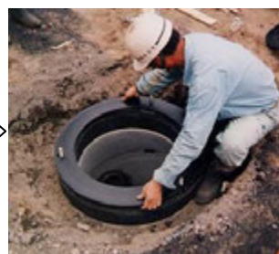
④ プラパッキンセット完了。