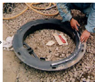
⑤ 鉄蓋枠裏面にプチルテープ又は、シールを装着する。