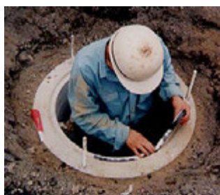
① プチルテープ又は、シールを装着する。