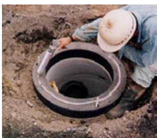
③ プラパッキンを乗せる場合はシール剤を塗布する。