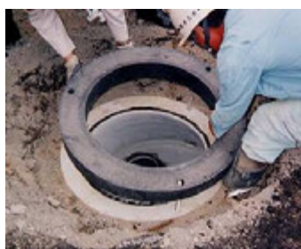
② プラ調整リングを乗せる