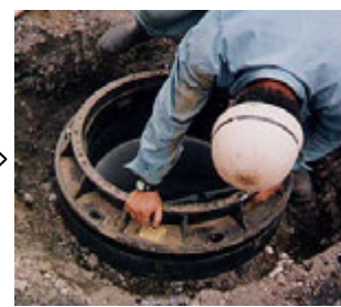
⑥ 鉄蓋を乗せて完了。